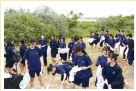
ももさだ海岸ボランティア

新屋高校では生徒の自主活動が活発で、海岸のゴミ拾いや特別支援学校・幼稚園等の訪問を通じて、ボランティア活動や交流活動、地域教材の研究活動などを積極的に行い新屋地域との交流を図っています。