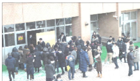
2月8日 前期選抜合格発表 1. 38倍を突破して、ひと足早く春到来！