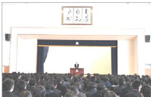
1月16日全校集会 校長先生のお話 「辰年は、生命が充実する年」